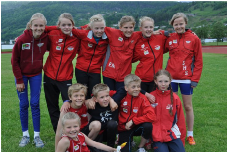
Fanas utøvere under Ulvikaleikane 13. juni 2010