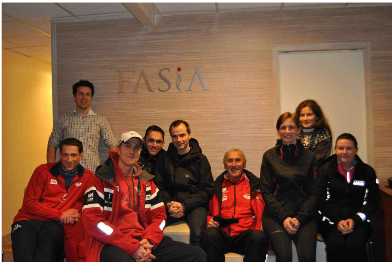
Noen av trenerne samlet på en trenersamling, her hos samarbeidspartner FASiA Osteopati