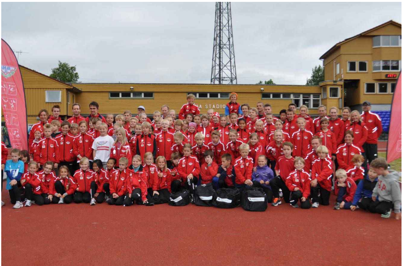
Stor oppslutning om sommeravslutningen 2012